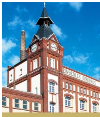
Brauhaus in Einsiedel

„EASY-Archiv ist ohne besondere EDV-Kenntnisse gut händelbar. Rechnungen und gescannte Lieferscheine inclusive Unterschrift sind jetzt schnell gefunden.“